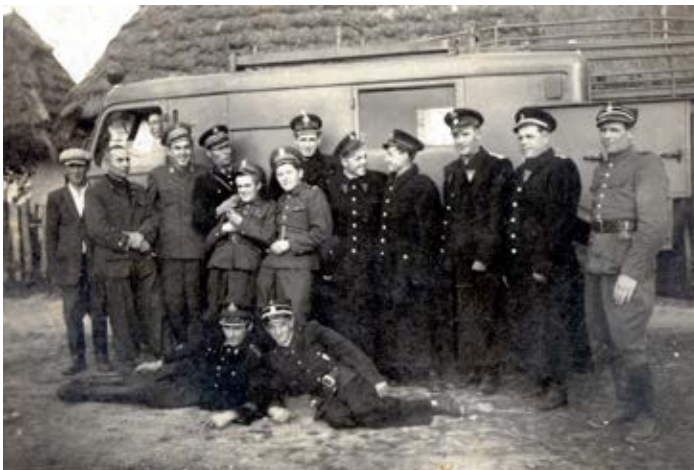
fot.: OSP Wólka Łabuńska; lata 50. (z arch. J. Nowosada)

W latach 50. XX w. jednostka otrzymała pompę wodną. Największą jednak trudnością był dowóz strażaków do miejsca akcji. Z pomocą przychodziło wówczas miejscowe kółko rolnicze. W tym okresie zakupiono przyczepę i motopompę M-80.