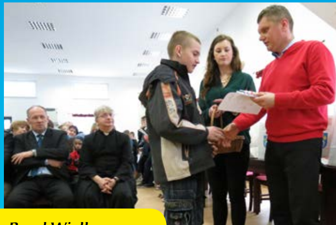
Laureaci V Konkursu Przed Wielkanocą