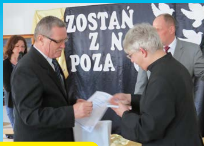
Jan Paweł II - Wspomnienie