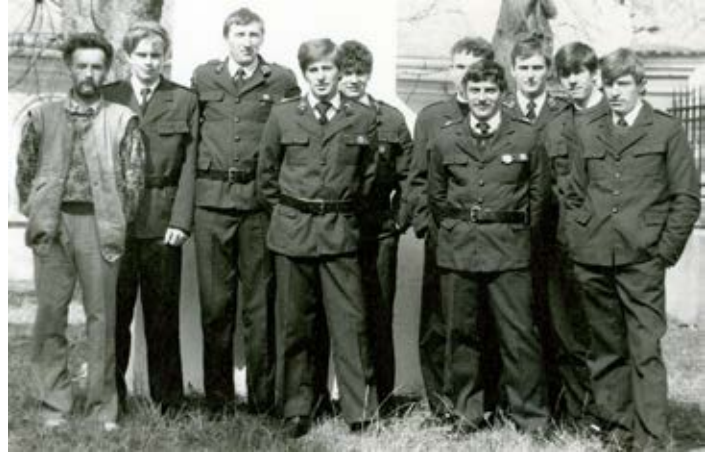
fot.: OSP Wólka Łabuńska; 1991 r. (z arch. K. Bodysa)

W 1982 r. naczelnikiem jednostki został wybrany dh Władysław Skiba . OSP pozyskała nowe mundury, sprzęt do działań przeciwpożarowych i ochronnych.