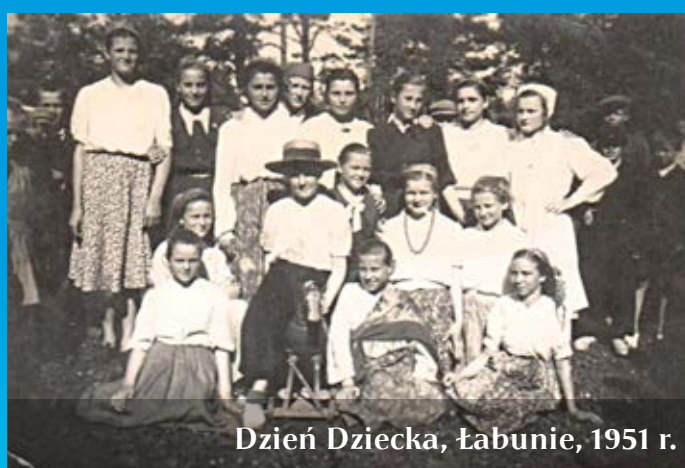
Dzień Dziecka, Łabunie, 1951 r.