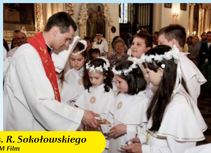
Msza prymicyjna ks. R. Sokołowskiego