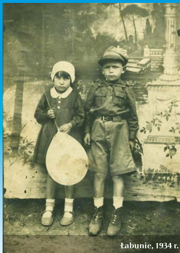
Łabunie, 1934 r.