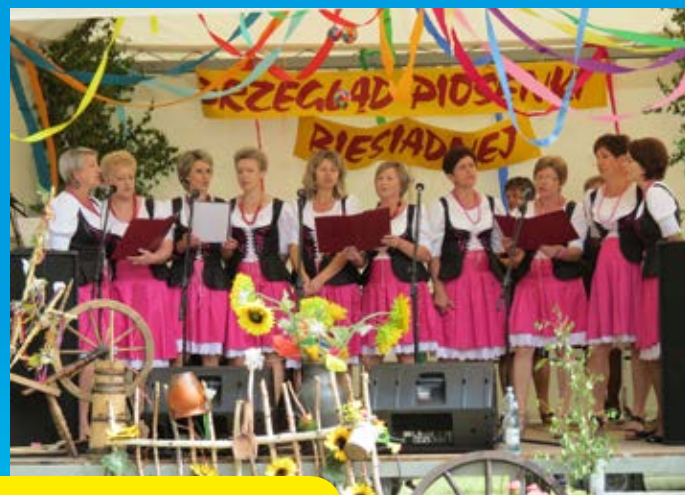
Biesiada w Wólce Łabuńskiej