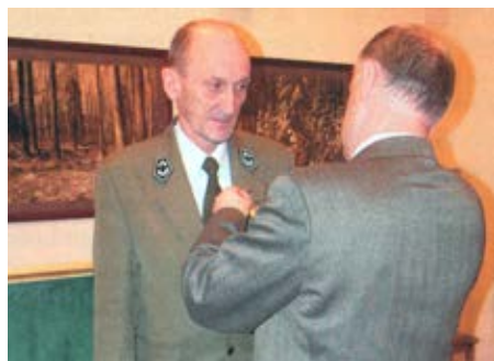
na fot.: p. J. Szkatuba - Odznaczony Złotą Odznaką „Zasłużony dla Leśników Polskich”; Janów Lubelski 3-4 marca 2014 r. www.zlpwrp.pl

Na stanowisku leśniczego miałem stopień zawodowy – adiunkt III stopnia.