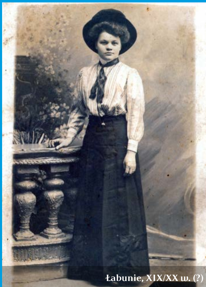
Łabunie, XIX/XX w. (?)