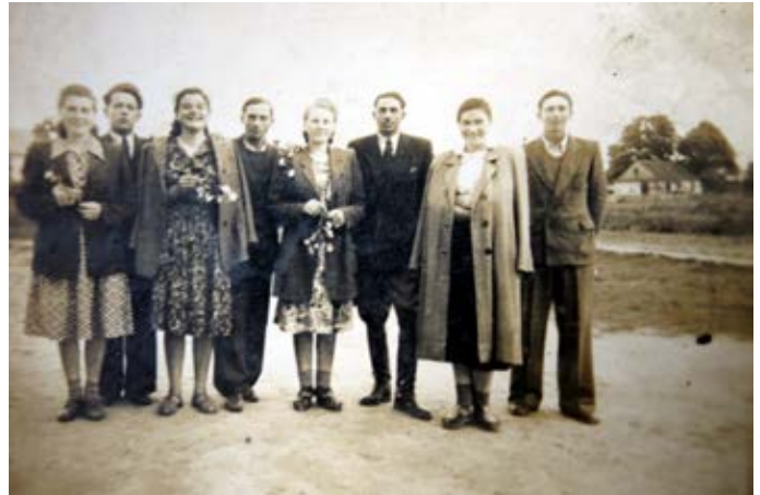
młodzież z Ruszowa; lata 50.

jednego dnia na urlopie. Gdy matka była chora to ja chodziłam, gdy ja miałam małe dzieci to chodziła ona.