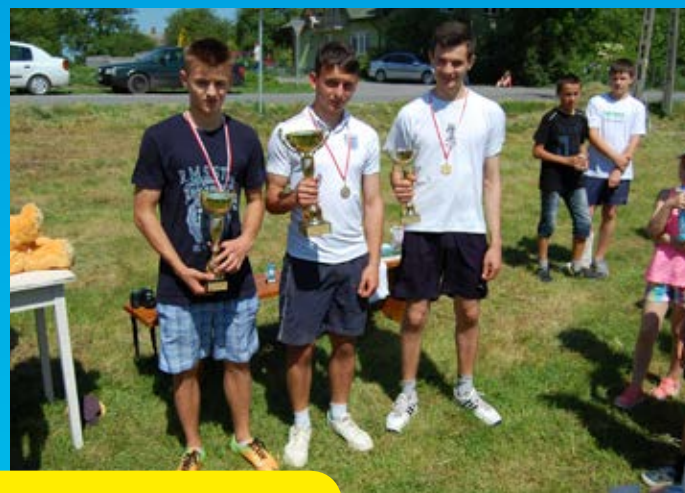
V edycja Polska Biega