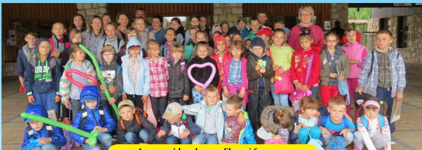
Laureaci konkursu Flora i fauna... w zamojskim ogrodzie zoologicznym